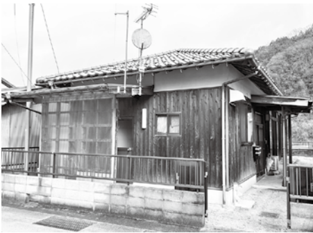
活用に向けた積極的対応が急がれる

空き家対策事業については、事業の進捗が見られず、空き家の登録数、ホームページへの掲載も動きがみられない。実態を把握しながら活用に向けて積極的な調査の実施と所有者への働きかけを行われない。