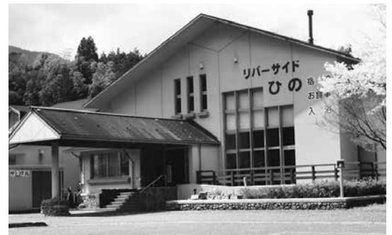
リバーサイドひの