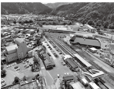
上空から見た根雨駅周辺

り課題や具体的内容を探ねます。 町長 創業意欲を持つ事業者の方々からは、会社設立後の申請が難しいことや補助金額等についてご意見をいただいております。こうした状況を踏まえ、今後は要件の緩和や補助金額の増額等、制度の改善を検討してまいります。 議員 創業支援だけでなく、事業承継支援も大事です。 町長 事業承継について改めて重要性を実感しているので、今後どのように支援するべきか考えていきたいと思えます。 議員 根雨駅周辺の整備計画について、具体的な内容やスケジュールを教えてください。 町長 計画に舟場地区と野田地区を加えたのは、広範囲でのまちづくりを進めたいので財源を確保できる可能性を考えたためです。任期4年間で計画を進め、完了ではなく着手することを目指します。