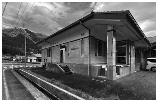
日野町学校給食センター