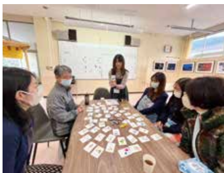
健康相談 (旧日野中学校)