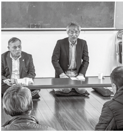
町づくりは公聴活動から

チャンネルひので、議会中継がご覧いただけます。 議員名下の二次元コードをスマートフォンやタブレットで読み取ると、 各議員の一般質問動画が視聴できます。