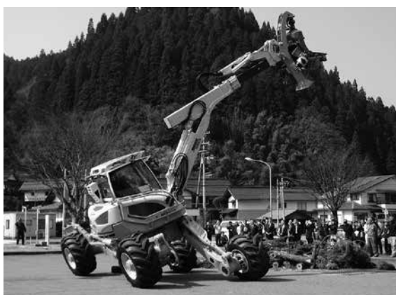
デモンストレーション風景

また、スパイダーは防水機能に優れ、タイヤ駆動のため災害現場などへの機動力もあり、林業用だけでなく危険が伴う河川災害などに今後幅広い活用が期待される。