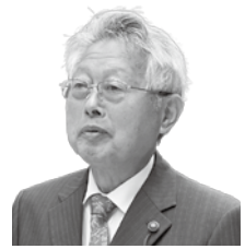
松本 利秋 議員