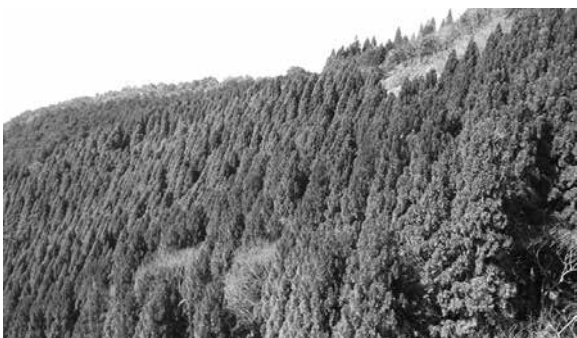
人工林が多い日野町山林