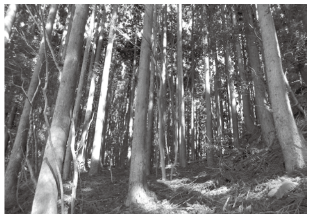
資源活用が待たれるスギ人工林

開設事業を8年度より着手します。 議員 林業事業体を増やし、生産 性向上の施策については。