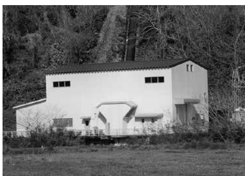
日野川第1発電所(福長)