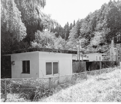
黒坂地区簡易水道浄水施設