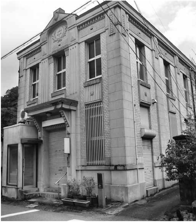
旧山陰合同銀行根雨支店