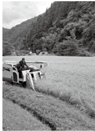
農林振興公社の作業風景

アもたくさんありますから、そう いったものも活用しながらまずは 広げていく。広げるといふか、意 識を向けていくのが大事なかなと 思っております。