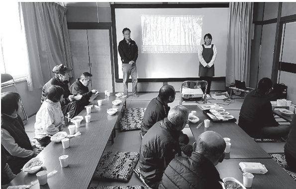
▲小さな拠点「雲海の郷真住」設立総会

個々の集落だけでは解決が困難な、生活機能の維持・確保などの課題に対応するために、複数の集落で協力し合いながら、地域を元気にする取り組みです。安心して暮らし続けられる地域の維持、住民の生活の質の維持・向上のために、持続可能な地域にしていく必要が求められています。