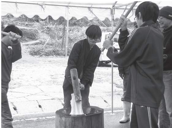
地域の人に教わりながら、杵と臼で餅つき

12月14日、高尾地区で、地域の人たちと日野高校双葉寮生、下宿生が餅つきを行いました。