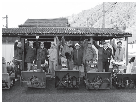
共助の力で地域の冬を支えます

12月19日、JR上菅駅前で、菅福地区自主防災除雪隊結団式が行われました。 菅福地区の除雪隊は、自力での除雪が困難な世帯の不安を解消し、安心して春を迎えてもらおうと、2014年から活動を行っています。 この日は、除雪隊のメンバーである菅福地区の民生委員やボランティアなど9人が集合。除雪地域の確認などを行い、「共助の精神で、安心安全な地域づくりに貢献したい」と、決意を新たにしました。