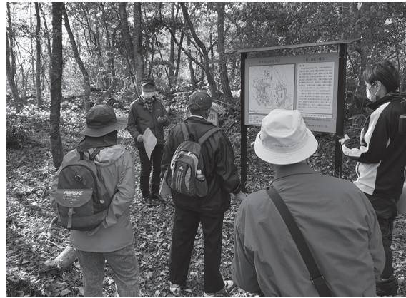
山城跡で解説を聞く参加者

11月29日、鏡山城とも呼ばれる黒坂城の跡地などを巡る、黒坂鏡山城ウォークが行われました。