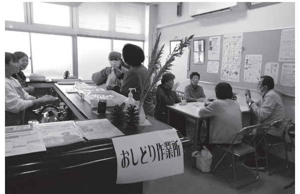
- ご来場ありがとうございました! -