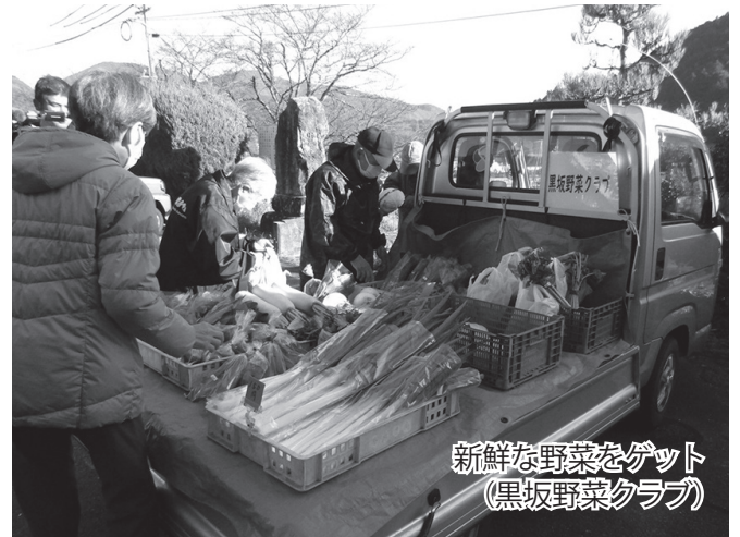
新鮮な野菜をゲット (黒坂野菜クラブ)