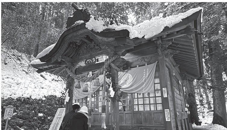
開運を願い、多くの人が参拝に訪れた金持神社

良い年になるようお願いを込めて 町内各地で年越し・初もうで 年が明け、今年一年の無病息災などを願い、町内各地の神社で初もうでに出かける人の姿が見られました。 毎年多くの参拝者が訪れる金持神社では、12月31日(大みそか)の深夜から、町内をはじめ県内外から参拝者が訪れました。 金持神社の元旦から1月3日にかけての人出は約10,500人。多くの人でにぎわい、参拝者は家族の無病息災や金運・開運成就など、さまざまな願いごとをしていました。札所では、スタッフらが「良い年になりますように」と、温かい言葉をかける様子が見られました。