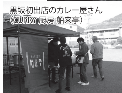
黒坂初出店のカレー屋さん (CURRY 厨房 舶来亭)