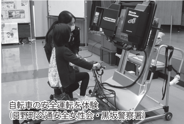
自転車の安全運転を体験 (目野町交通安全女性会・黒坂警察署)

日ごろから活動している団体や個人など26組が参加し、公民館での生涯学習の成果としての作品や活動報告などの展示に加え、バザーやテント村がオープン。各種講座も開催され、196人が来場しました。