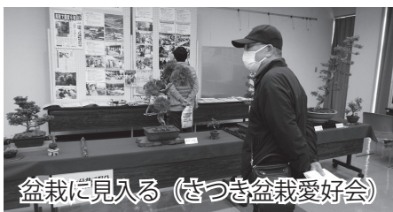
盆栽に見入る(さつき盆栽愛好会)