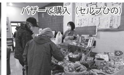
バザーで購入(セルブひの)