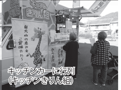
キッチンカーに行列 (キッチンきりん組)