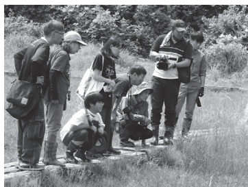
▲木道の上から観察