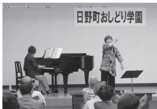
▲「タントントン」と肩をたたいて 歌い会場が一体に