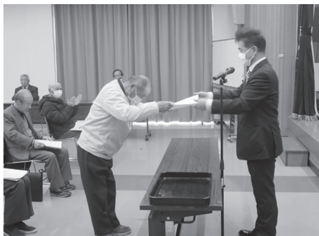
▲休むことなく受講された学園生に皆勤賞を授与

編集 日野町公民館 〒689-5131 日野町黒坂1243番地1 電話：74-0212 FAX：74-0105 E-mail：kouminkan@town.hino.tottori.jp