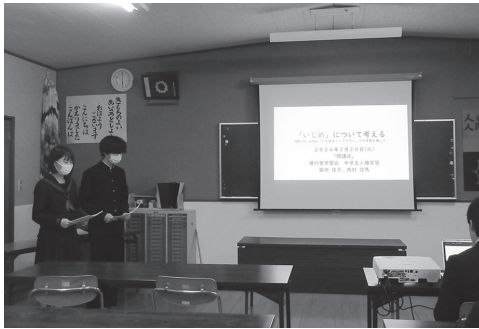
▲一年間の学習成果を発表する8年生

はじめに、生田教育長から、「一年間おつかれさまでした。二人の作品集を読ませてもらいましたが、一年間の学習内容や思ったこと・考えたことが書いてありました。自分ではなかなか気付かないかもしれません、二人が小学校に入学してからこれまで続けてきた学習会での成長が、この作品集を読んで伝わってきました。確実に二人の