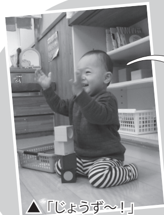
▲「じょうず〜！」 拍手で積み木が上手に積めたことを喜びました！