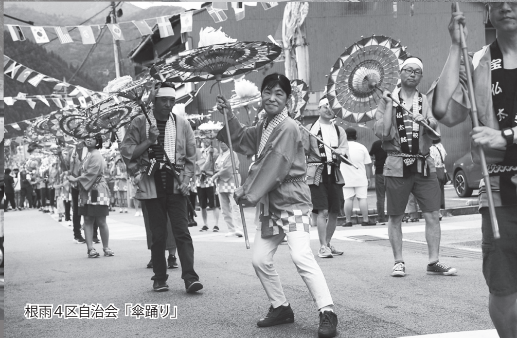
根雨4区自治会「傘踊り」