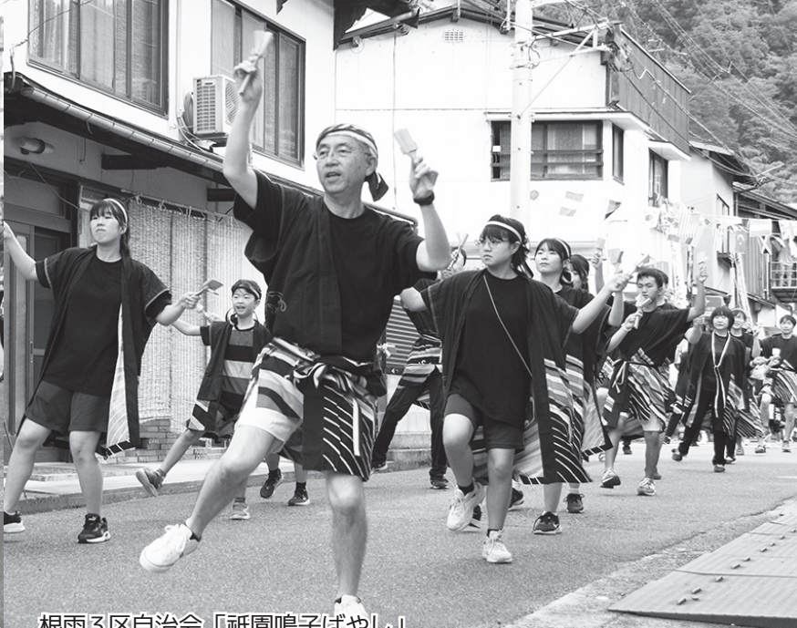
根雨3区自治会「祇園鳴子ばやし」