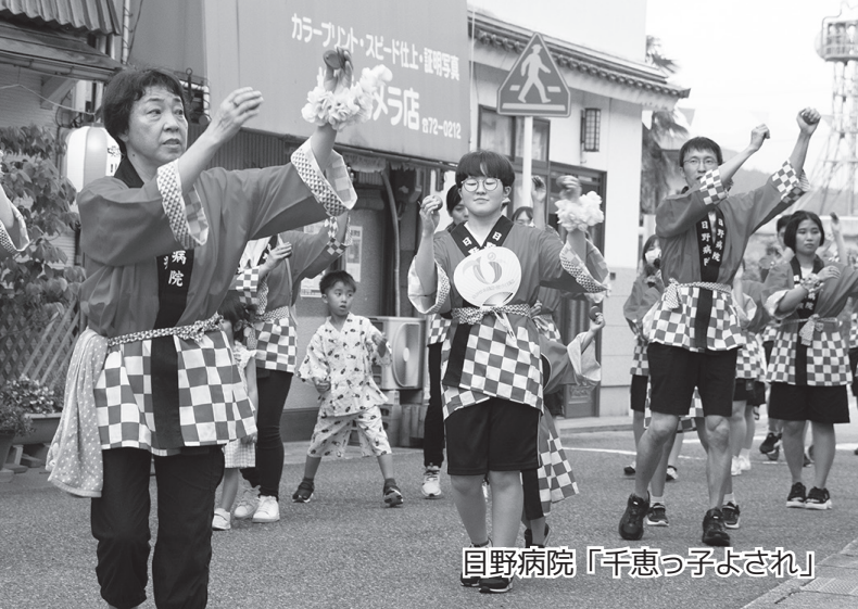
目野病院「千恵っ子よされ」