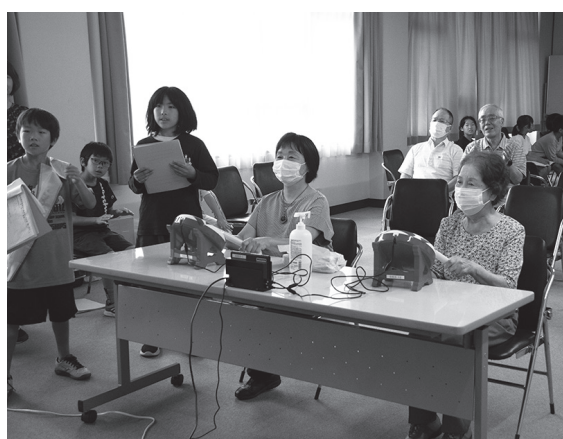
リズムにのって太鼓を叩く参加者の皆さん

7月13日、山村開発センターで、日野学園4年生と地域の高齢者が、Weスポーツ交流会を行いました。 Weスポーツとは、ゲームを通じて健康増進と交流を図るものです。当日は、「健康ゲーム指導士」の資格を取得している日野学園4年生の児童たちが進行役となり、地域のいきいき百歳体操実施団体の皆さんと一緒に、リズムゲーム「太鼓の達人」で交流を行いました。 参加者は、「子どもたちがかけ声をかけてくれたのでやりやすかった」と、笑顔で話しました。