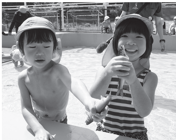
元気いっぱいアユをつかまえる園児たち

7月28日、ひのっこ保育所で、アユのつかみ取り大会が行われました。これは、自然に対する理解を深め、ふるさとへの愛情を育てたいと、町水産振興連合会の協力を得て、毎年行っているものです。 当日は快晴で、強い日差しが照り付ける中、約200匹のアユがプールに放されると、園児たちからは「つかまえた！」と嬉しそうな声が上がりました。中には2、3匹いっぺんにつかまえる子も。 勢いよく泳ぐアユを前に、笑顔を見せていました。