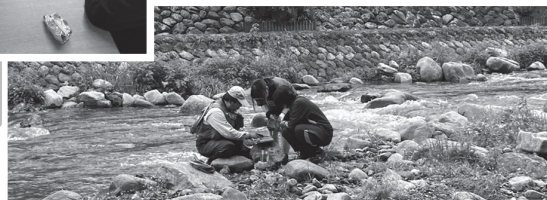
▶板井原川で水生昆虫採集