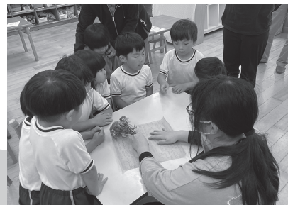
▲皆で楽しくラッピング♪

当日までに、買い出しやスケジュール調整と慣れないことばかりで大変でしたが、参加した生徒2人はしっかりと準備に取り組みました。子どもたちも笑顔で楽しんでいました。