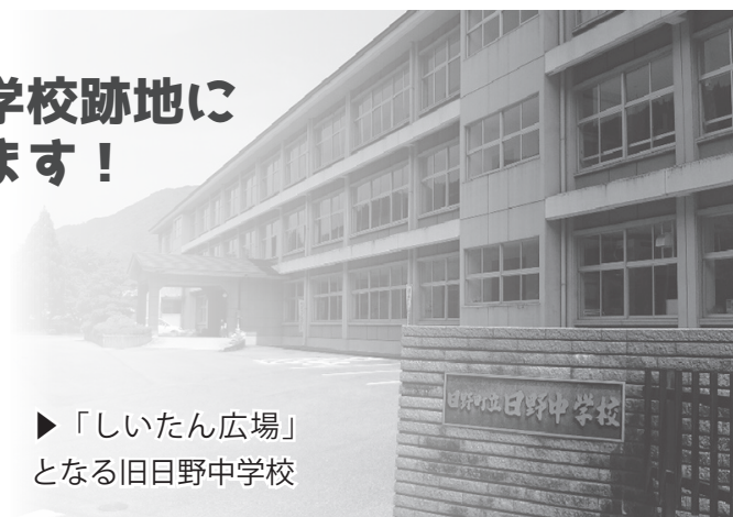
▶「しいたん広場」 となる旧日野中学校