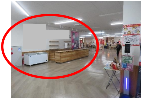
1 入口から見た状況