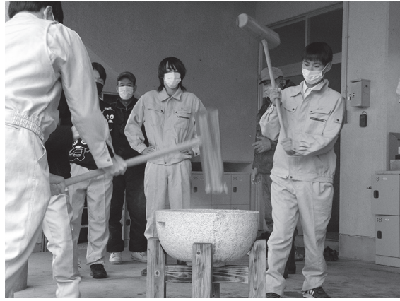
正月用のもちをぺったんぺったん

町内の特産品などを届け、ふるさとの味を思い出し、もらうと、ニコニコ朝市グループが、毎年恒例の「ふるさと便」の発送作業を、12月23日、町山村開発センターで行いました。 ふるさと便には、大夢多夢のきねつきもちや、町内産の米などが詰められています。 今回も全国から約80件の申し込みがあり、会員らは「ぜひふるさとの味を堪能してほしい」と、互いに声を掛け合いながら箱詰めなどの作業に追われていました。