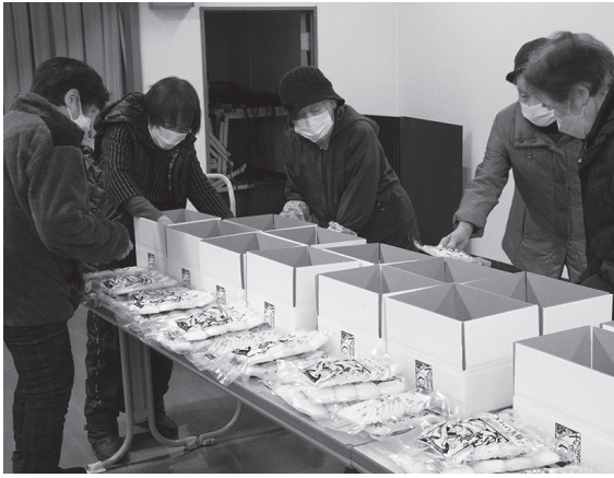
一つ一つ確認しながら丁寧に箱詰めを行う