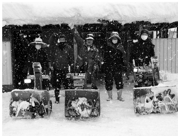
やる気を見せる除雪隊のメンバー

12月23日、JR上菅駅前、菅福自主防災除雪隊結団式が行われました。菅福地区の除雪隊は、自力での除雪が困難な世帯の不安を解消し、安心して春を迎えてもらおうと、2014年から活動を行っています。この日は、除雪隊のメンバーである菅福地区の民生委員やボランティアなど8人が集合し、早速、朝から降り続いた雪を除雪しに出動。「共助の精神で、安心安全な地域づくりに貢献したい」と話し、決意を新たにしていました。