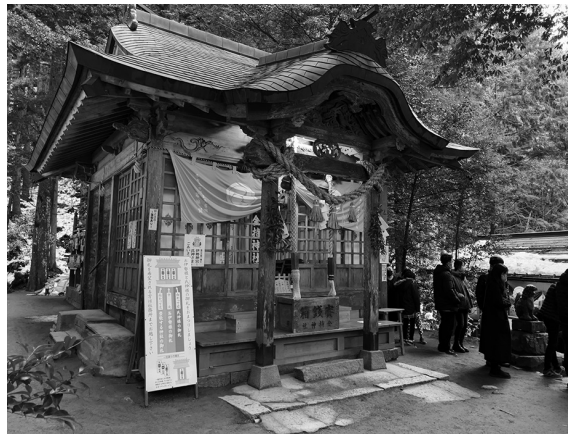
金運・開運を願い多くの人が訪れた金持神社

年が明け、今年一年の無病息災などを願い、町内各地の神社で初もうでに出かける人の姿が見られました。毎年多くの参拝者が訪れる金持神社では、12月31日(大みそか)の深夜から、町内をはじめ県内外から参拝者が訪れました。金持神社の元旦から1月3日にかけての人出は約15,200人。12月下旬に降り積もった雪が残る中、多くの人でにぎわい、参拝者は家族の無病息災や金運・開運成就など、さまざまな願いごとをしていました。