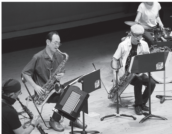
生バンドの迫力ある演奏で楽しいひとときを

6月19日、町文化センターで、サロンコンサート「サククスボックスコンサート」(ホールと共に歩む会主催)が開かれました。 今回は、県西部を中心に活動するサクソホン・アンサンブルのグループ「サククスボックス」を招き、クラシックや歌謡曲など、さまざまなジャンルの曲が披露されました。 演奏は「夏の日本の歌メドレー」からはじまり、「異邦人」など誰もが一度は聴いたことがある曲ばかり。参加した約70人は、久しぶりの生の演奏に聴き入っていました。