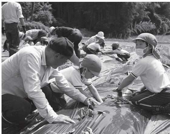
優しく教えてもらいながら苗植え

6月10日、津地市内の畑で、ひのっこ保育所と津地自治会とのサツマイモ植え交流会が行われました。 当日は、保育所から年長児14人が参加。用意されたサツマイモの苗約300本を、地域の皆さんと一緒に植えていきました。 毎年行われているこの交流会。苗を植えながら、「早く大きくなってね!」「育つのが楽しみ」と、園児たちのにぎやかな声が響きわたっていました。秋には、イモ掘り収穫祭が開かれる予定です。