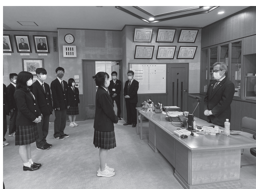
▲一人ずつ高校生活の目標を発表しました

埴田町長からは、「自然豊かな日野町で、地域の皆さんと濃密にふれあいながら、充実した高校生活を送ってください」と、歓迎の言葉が贈られました。