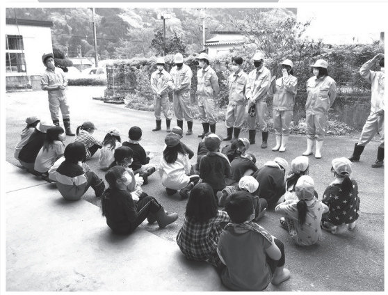
▲はじめまして！これから一緒にがんばりましょう

お互いにあいさつをした後、まずはジャガイモについての勉強からスタート。ジャガイモにも、種類がたくさんあります。そのなかから、今回は「男爵」「メークイン」「シャドークイーン」の3種類を植えることになりました。