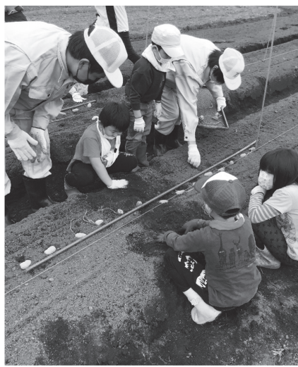
◀ジャガイモの植え方を優しく教える高校生たち