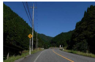
間地峠 標高490m。 溝口にむかう旧街道 の峠。春には桜が 咲き、冬には雪景色 が広がる。