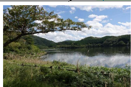
鵜の池 新緑や紅葉のシーズン にかけてにぎわう。また、野鳥の 宝庫としても知られている。