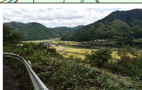
長楽寺へ向かう道からの眺望 眼下に下榎の田園を走る伯備線 と日野川を望む。