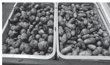
▲こんなにたくさんのジャガイモが！

収穫量は、「男爵芋」が25kg、「メークイン」が27kgでした。比較的ジャガイモの大きさも揃っており、スーパーで売っているものと遜色ないジャガイモが収穫できました。