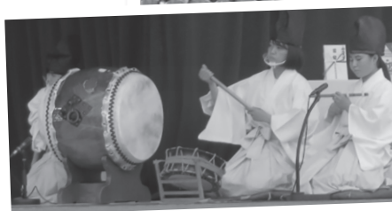
▲部員全員の力を合わせました