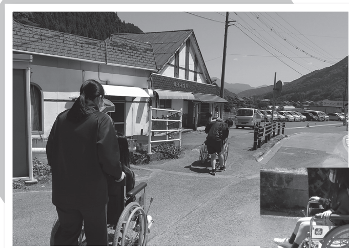
▲いつもの道も、車いすだと違う景色に

3年生ヒューマンケア系列の生徒が、「生活と福祉」の授業で車いすの校外実習を行いました。