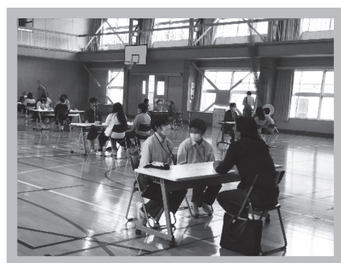
▲世代を超えて楽しくおしゃべり！

1年生「産業社会と人間」の授業で、「おしどりトーク」を実施しました。この「おしどりトーク」は、日野郡内に住む地域の皆さんを招き、大人と高校生が、さまざまなテーマについて語り合う活動です。