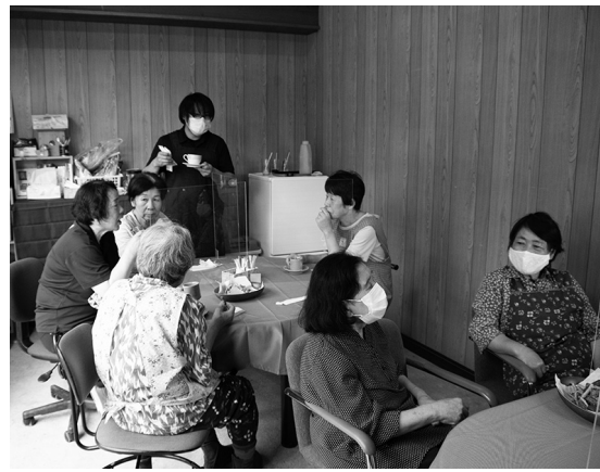
おいしいコーヒーとお菓子でおしゃべりが弾む

7月1日、「ムラづくりカフェすげふく」が、JR上菅駅前の地域おこし協力隊事務所でオープンしました。