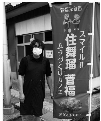
▲旗が立っている時が開店日です

当日は、近所に住む人や菅福元気邑に通う人たちなど、多くの町民が来店。コーヒーやお菓子などが振る舞われ、来店した人同士で会話を楽しむ姿が見られました。