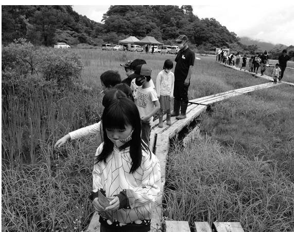
リニューアルした木道を通して観察する参加者

6月19日、滝山公園湿地ビオトープ（小さなトンボ王国）で、「ハッチョウトンボを探しに行こう！」が開かれました。