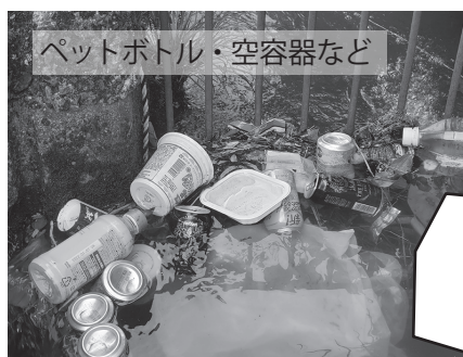
ペットボトル・空容器など