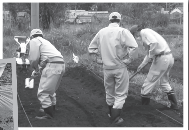
▲立派に育つよう気持ちを込めて畑作り