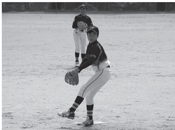
最後の一球まで力を込めて投げる

5月8日、江府町民グラウンドで、令和3年度鳥取県スポーツ少年団軟式野球交流大会西部地区大会が行われました。