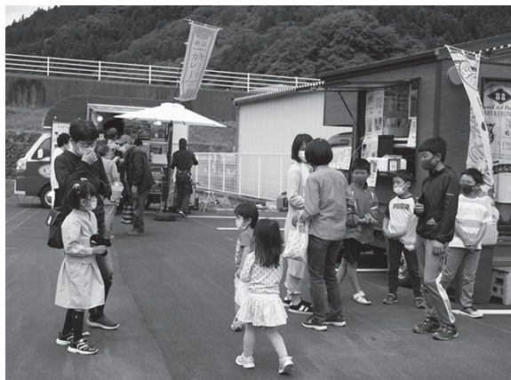
テイクアウトのキッチンカーが並ぶ

5月22日、金持テラスひので、葬祭施設新装オープン記念として、春のうまいものフェアが開かれました。