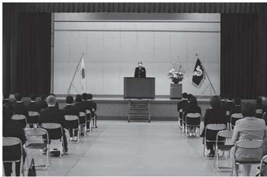
▲期待を胸に抱いて。新たな学校生活へ