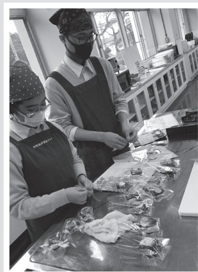
▲お世話になった人の顔を思い浮かべながら、心を込めて手作り