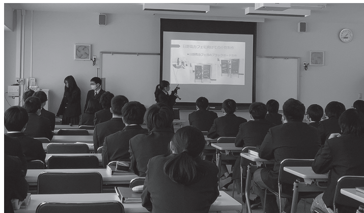
▲課題研究発表最後の締めは、同じ学びやの生徒の前で

生徒からは、「研究テーマのスイーツの試作を何回も繰り返しながら、何がダメで、何がよいのかを考えながら活動できた」「地域の皆さんとお会いするなかで、私はまだまだだと思っても、ちょっとしたことで喜んでくださって、うれしかった」などの感想が。