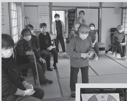
▲ターゲットゲームや輪投げを楽しみ、笑い合う参加者の皆さん