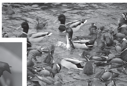
◀南方系のチョウの仲間 クロコノマチョウ

学園生は、日野町の自然を知る良い機会になったとともに、この豊かな自然と共存し、保護していくためにはどうすればいいのかを考えるきっかけとなつたようです。