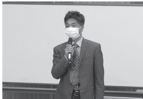
▲日野町の豊かな自然について語る神庭館長