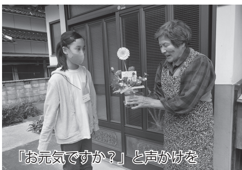
「お元気ですか?」と声かけを