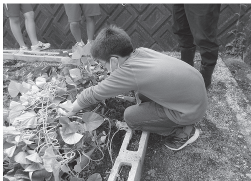
▲「うまく育ってるかな」収穫にワクワク

カボチャは3個収穫。ミニトマトは台風にも負けず鈴なりに実り、収穫した野菜に子どもたちは大喜びでした。「早く食べたい!」と言っている姿を見て、収穫できてほっとしたと同時に、嬉しく思いました。