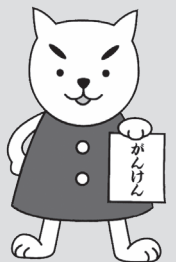
日野町がん予防キャラクター がんけん

※4 協会けんぽなどの他保険被扶養者の方も特定健診を受診できます。保険者から届く受診券を会場まで持参してください。ただし、自己負担金は、他保険が受診券に定めている額になります。