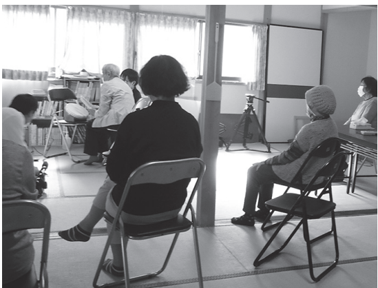
ゲームの操作方法を高校生が分かりやすく説明

10月21日、高尾公会堂で、日野高校生と高尾自治会が、eスポーツを楽しみました。