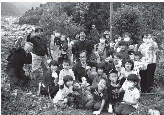
植樹に参加した児童たちと保護者、関係者ら

10月10日、塔の峰公園で、黒坂小学校と根雨小学校の児童が桜の植樹を行いました。町では、昨年度に町制60周年を記念して滝山公園に桜を植樹し、来年5月には、滝山公園で鳥取県植樹祭が開催される予定です。このたびの事業は、さらなる緑化意識の高揚を図るため、緑の募金還元金を活用し行われたものです。当日は、児童10人と保護者らが参加。保護者や関係者が見守るなか、児童らは「元気に大きく育