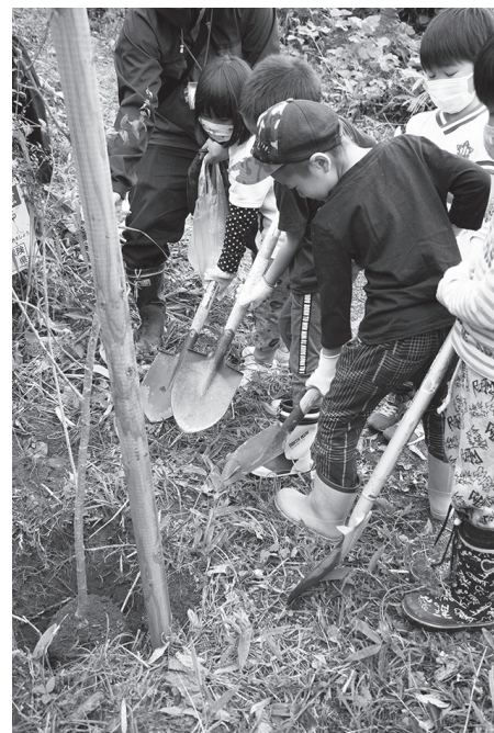
ソメイヨシノを植樹する児童たち

「ちますように」「きれいな桜が咲きますように」と心を込めながら、ソメイヨシノ10本をスコップを使って一生懸命に植えていきました。