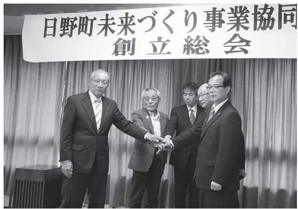
県内で設立されたのは日野町が初

11月2日、国の「特定地域づくり事業協同組合制度」を基にした「日野町未来づくり事業協同組合」の創立総会が、町商工会で行われました。