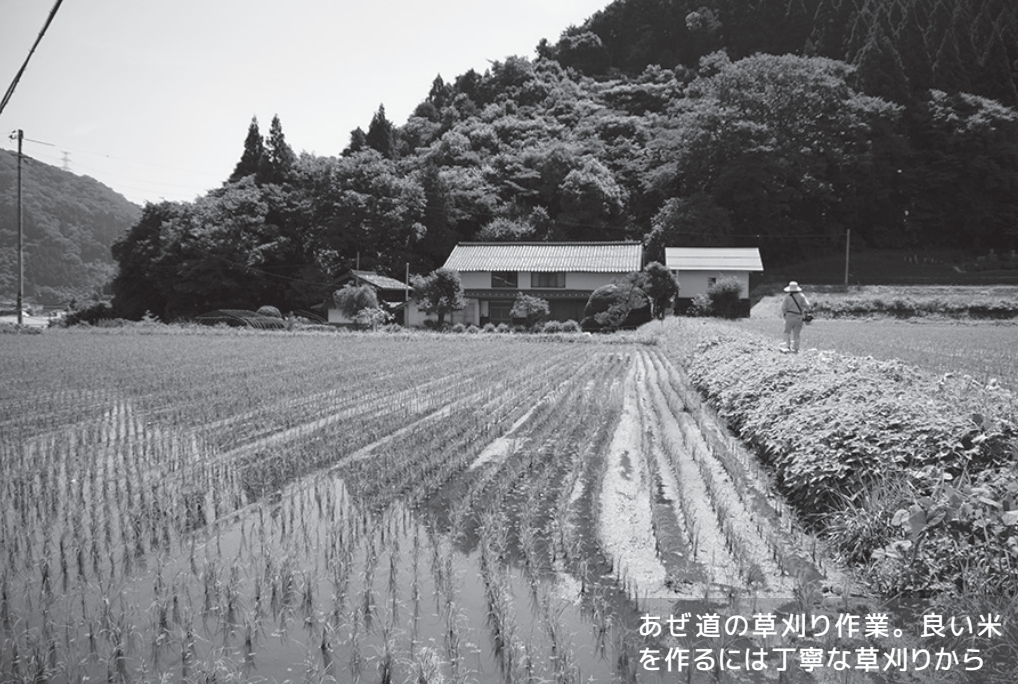
あぜ道の草刈り作業。良い米を作るには丁寧な草刈りから