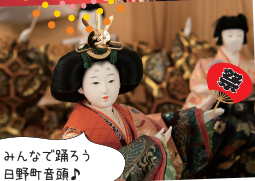
みんなで踊ろう 日野町音頭♪