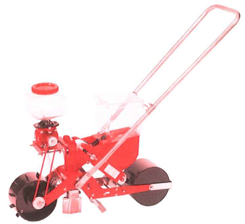
HS-300EH (LH) 播種機+薬剤散布 (オプション)

※マーカー、2条用アタッチメント、薬剤散布装置はオプションでもお買い求めいただけます。