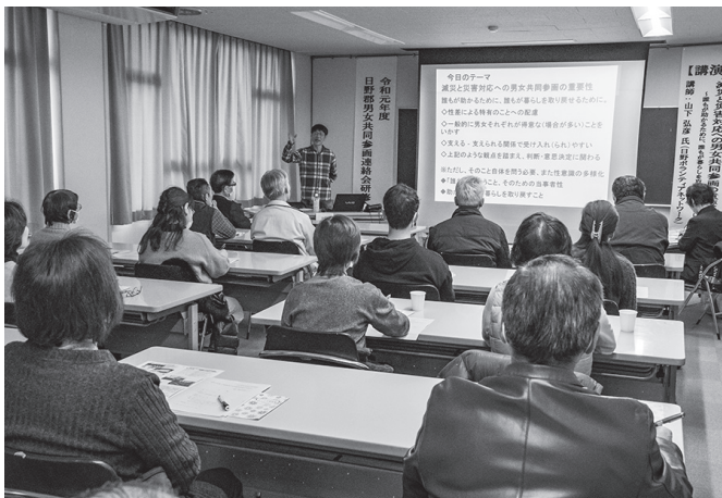
日野郡内外から20人余りが参加