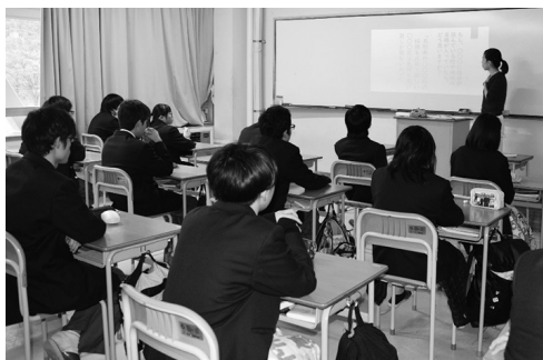
▲人権教育 LHR 公開授業の様子

●11月：「人権教育LHR公開授業」(※3年次生は12月に実施)、「共生社会を目指して」ライラを下げする方法(1年次生)、「被差別部落の現実から考える」(2年次生)、「差別問題を通して、様々な人権課題を解決する行動力と実践力を身につける」(3年次生)