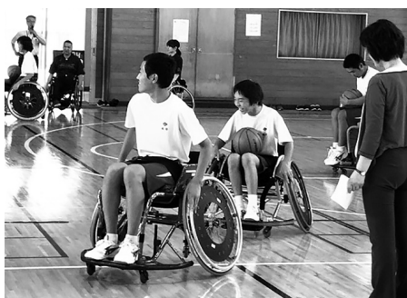
▲誰でも楽しめる！その魅力を実感

や試合を行いました。授業後の生徒の感想をみると、競技を体験することが多く、多くのことを学ぶことができました。