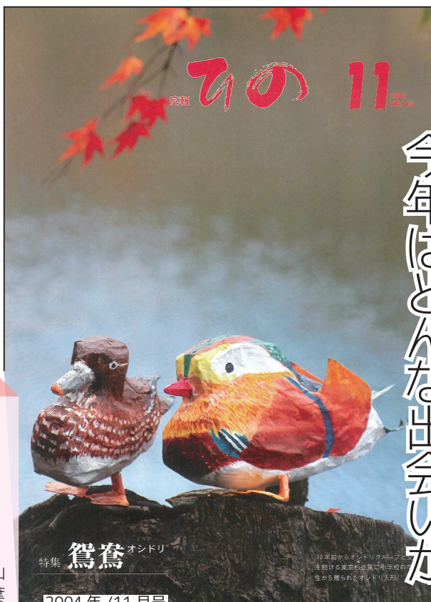
特集 鴛鴦 オンドリ

今や定番イベントとなった滝山神社から金持神社までを紅葉と開運を求めて歩く「金持開運ウォーキング」。かつては、「ヘルシーウォーキングひの」「もみじ開運ウォーキング」というイベントも開かれていました。