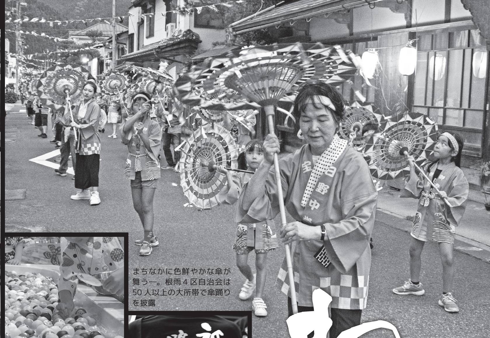
まちなかに色鮮やかな傘が舞う一。根雨4区自治会は50人以上の大所帯で傘踊りを披露