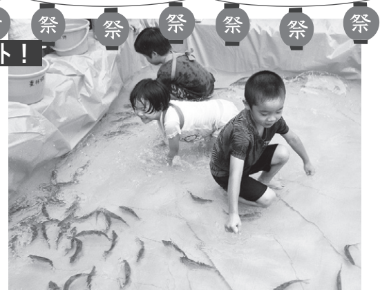
▲いけすの中を勢いよく泳ぐアユに、元気いっぱいなはずの子どもたちも悪戦苦闘。頑張れ〜! ◀祭りの人込みの中を歩き疲れた人にとって一休み＆団らんの場所に

7月20日、多くの人でにぎわったねう祭り。まちなかに提灯や吹き流しが飾られ、多くの屋台が立ち並ぶ中、自治会や町内事業所で構成された踊りの列がまちなかを練り歩き、夏祭りの夜を盛り上げました。最高潮に盛り上がった祭りの締めくくりは、約800発の花火。色とりどりの花火が夜空とまちを鮮やかに染め上げていました。