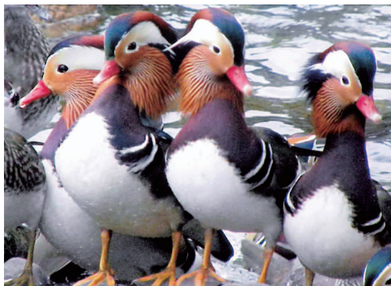
春一番が吹いた。ガッテン、北へ