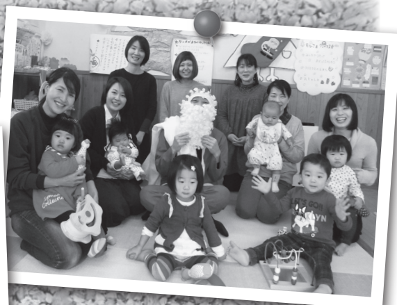
◀おでかけおひさまひろばでは、子どもたちも一緒にまぜまぜ...