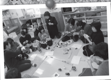
▲日野ボランティアネットワークの皆さんと編み物体験♪