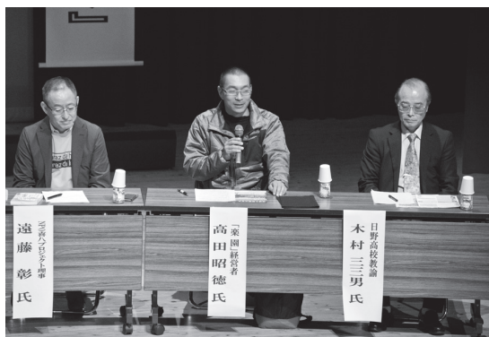
高校生が地域で学んだ知識をどう還元していくのか。地域活性化につながるヒントも

12月16日、町文化センターで、日野高校魅力向上シンポジウム（日野高校魅力向上推進協議会主催）が開かれました。 当日は、同校が和歌山大学と長年続けてきた交流事業の成果を発表。日野郡の農山村が抱える課題について、生徒自ら考えた解決策を提案しました。そのほか、県内外の専門家や地域住民ら4人がパネルディスカッションを行いました。 地域や行政、学校の連携の重要性が確認され、「地域に人材を残すには、ふるさとに誇りを持つ人を育てることが重要」など、活発な意見が交わされました。