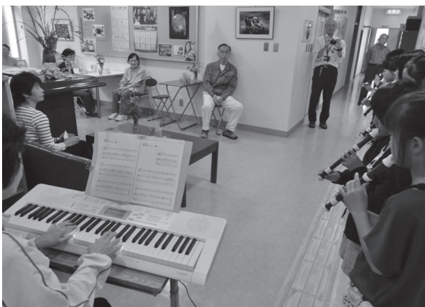
▲3・4年生はリコーダー演奏を披露(9/20)

黒坂小学校では、毎週火・木曜日に開店するおしゃべりカフェで、学習発表を行っています。