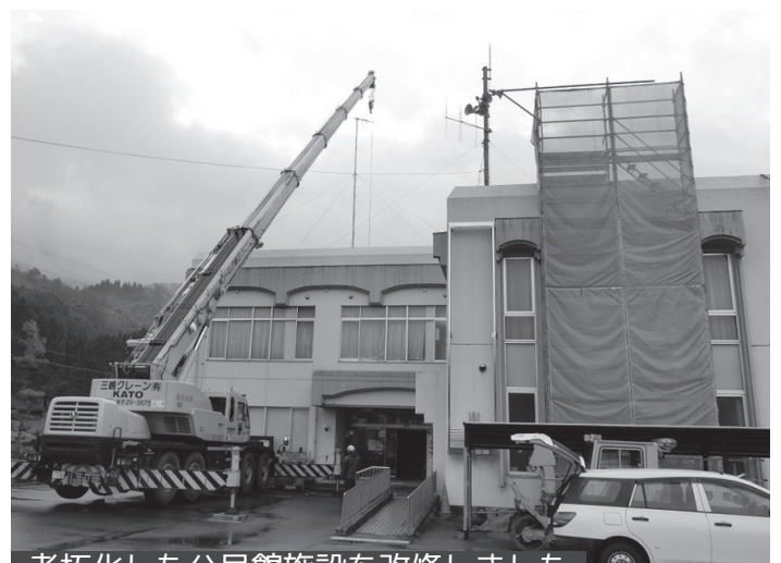
老朽化した公民館施設を改修しました