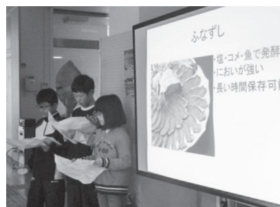
▲2年生は「自分の宝物」(10/2、左)、5年生は「和の魅力」がテーマ(12/4)