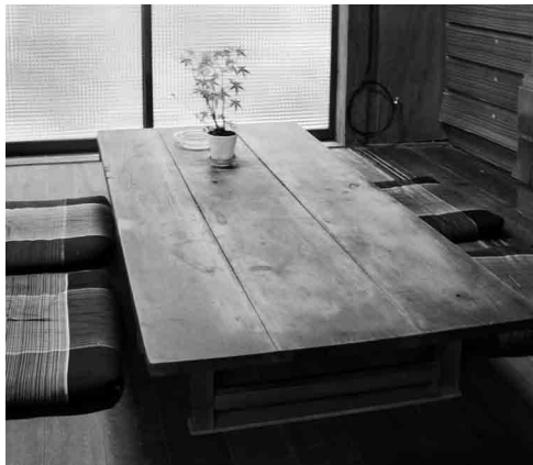
この部屋、長年「開かずの間」だったらしい…。今はきれいに改装され、ゲストの憩いの場に。1人で物思いにふけるもよし、みんなで語り合うもよし。#開かずの間から素敵な間へ