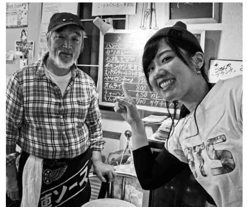
今日は、BTS（防弾少年団）が好きな常連さんとランチでバッタリ。いろんな人が集まって、面白い話が聞けるのも、マスターがいてこそ。#料理もおいしいし #マスター長生きしてね