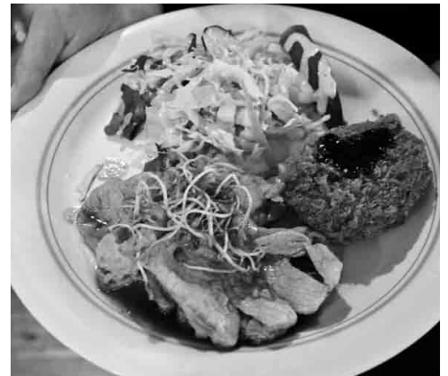
よし、ディナーはオーナーが営む「ごはんやランチ」にしよっと♪まちなかにある飲食店も近いから、何軒か回って俺ん家に…ってコースもあり。#ごはんやランチ