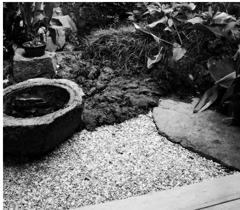
開かずの間の先には、こんなすてきな庭が。奥には小さな池があるというから驚き。ふらっと遊びに行きたいなあって思わせてくれます。#ミニ庭園でティータイム