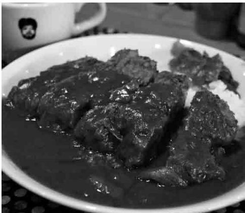
ランチ来たならコレ！名物「カツカレー」。肉厚でジューシーなカツが最高なんです！ただし、カレーが激辛だから覚悟してね。#撃沈！激辛カツカレー #辛くても良き？