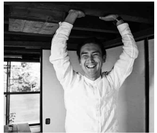
築70年以上の建物だけあって、とっても天井が低いんです。ちなみに、奥に見える天井から出てる箱は、掘りごたつなんだって！#背の高い人は頭に注意！