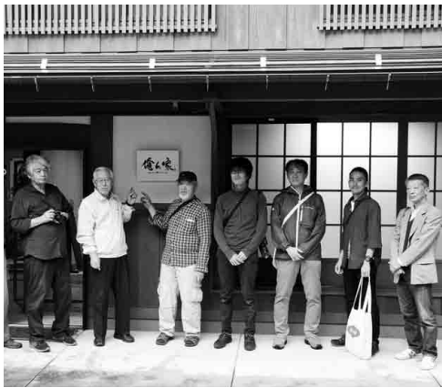
「俺ん家」のオープンに向けてサポートしてくれた皆さん。待ちきれずにすでに宿泊予約も入ってたみたい。#日野軍★みらい創生デザイン会議 #チームひの

根雨のまちなかにできた待望のゲストハウス。気になるその中身を、妄想たっぷりの写真共有アプリ「HINOSTAGRAM」で投稿してみました。もちろん、「俺ん家」はWi-Fi 完備！日野町のPRとともに、皆さんもSNSでその良さをバシバシ発信してくださいね～。