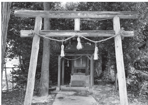
▲摩利支天神社には「ヤッテンさん」といわれる狐の伝説がある