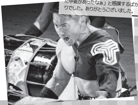
「7月の豪雨災害の影響を受け延期していた、舞太鼓あすか組の公演が無事開催されました。迫力ある演奏、情熱あふれる表情の一つ一つに、「待った甲斐があったなあ」と感嘆するばかりでした。ありがとうございました。」

西日本を中心に広範囲で発生した「平成30年7月豪雨災害」。日野町においても大雨特別警報が発令され、床下浸水や簡易水道の断水など大きな被害が発生しました。