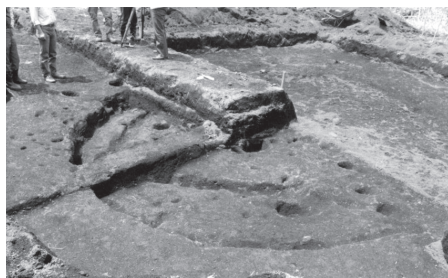
▲古墳時代の住居跡と推定される岩田遺跡

「ケーブルカーを付けて山に上がれるようにしたら」。そんな声もあり、この土地の知らない世界、伝統を引き継いで、祭りとともに地域を盛り上げたいと、今後の夢も語り合われました。（松田暢子Ⅱ政治・行政・教育小委員会）