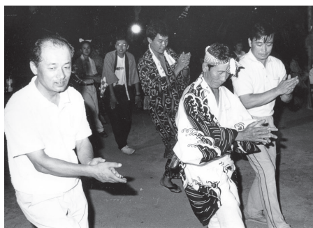
▲上菅の人から指導を受け盆踊りを復活