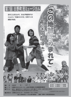
「この地球に生まれて～希望のたすき～」(2008)