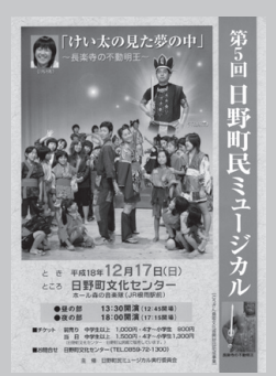
「けい太の見た夢の中～長楽寺の不動明王～」(2006)