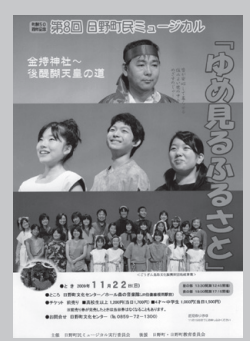
「夢見るふるさと 金持神社～後醍醐天皇の道」(2009)