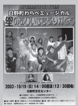
「星のおじさまありがとう」(2003)