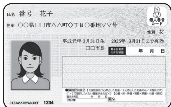
▲個人番号カード（イメージ）

「通知カード」も「個人番号カード」も「住所」は最新のものにする必要があります。「通知カード」をまだ受け取っていない人はお早めにお受け取りください。