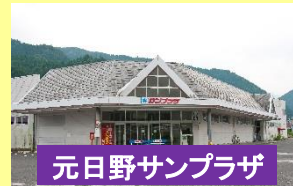
元日野サンプラザ