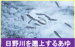
日野川を遡上するあゆ