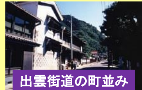
出雲街道の町並み