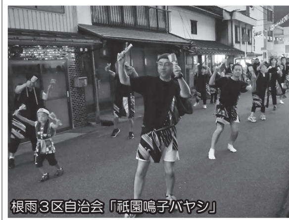
根雨3区自治会「祇園鳴子ハヤシ」