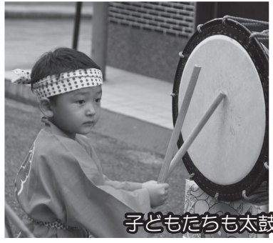
子どもたちも太鼓に踊りに大活躍！