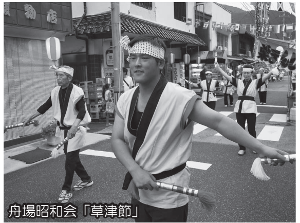
舟場昭和会「草津節」