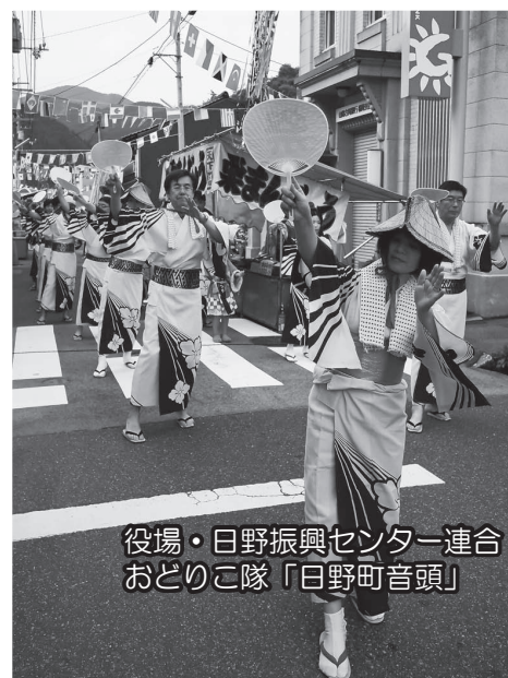
役場・日野振興センター連合 おどろこ隊「日野町音頭」