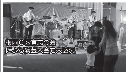
根雨6区有志の会 による演奏大会も大盛況