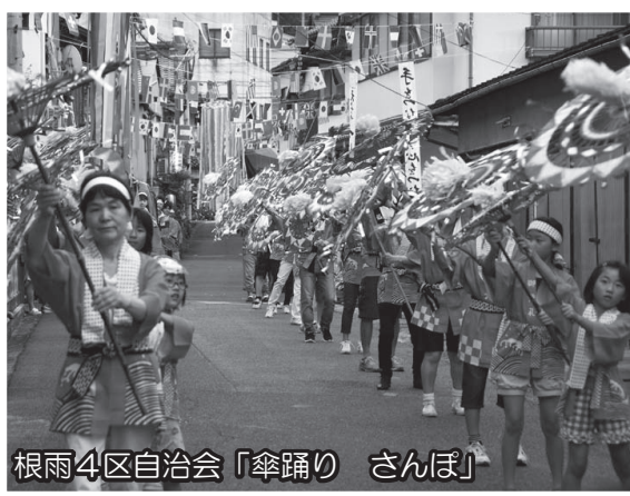
根雨4区自治会「傘踊り さんぽ」