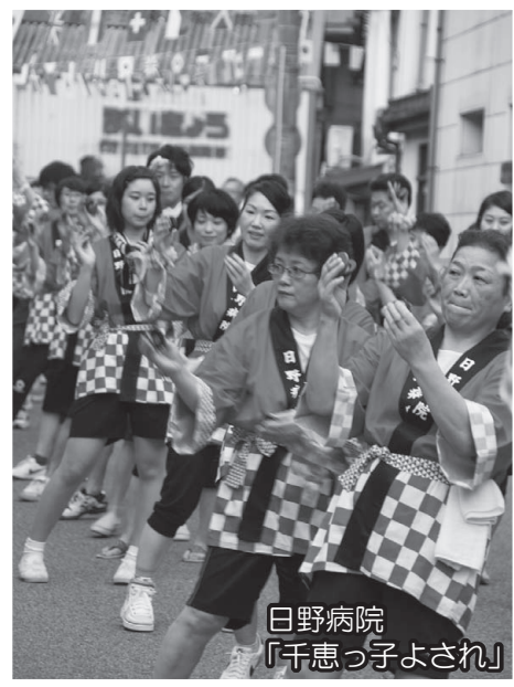
日野病院 「千恵っ子よされ」