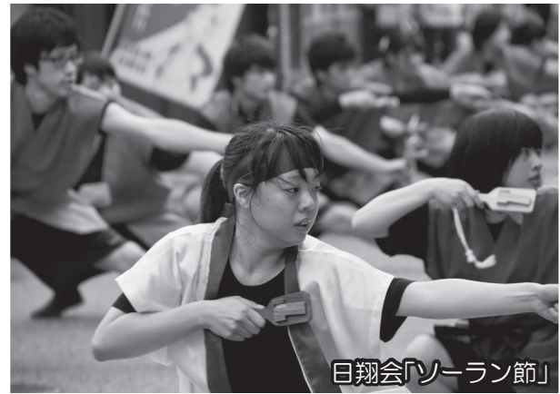
日翔会「ソーラン節」