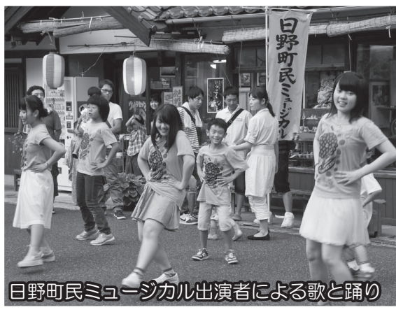
日野町民ミュージカル出演者による歌と踊り