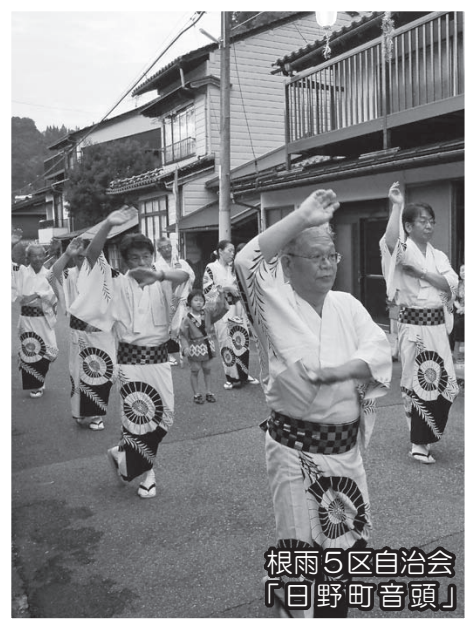
根雨5区自治会 「日野町音頭」