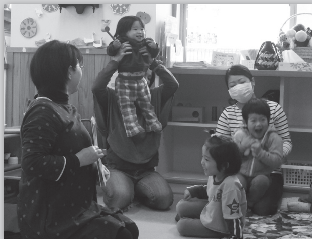
▲楽しいおはなし会になりました