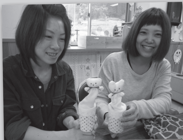
▲いないいないばあ人形でたくさん遊んでほしいな

お母さんたちが子どものために、ひと針ひと針、心を込めて作ってくれました。世界に一つしかない「いないいないばあ人形」です。このほか、ふれあい遊びやおはなし会も楽しみました。