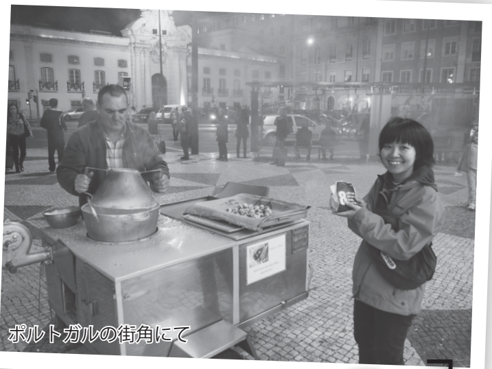
ポルトガルの街角にて