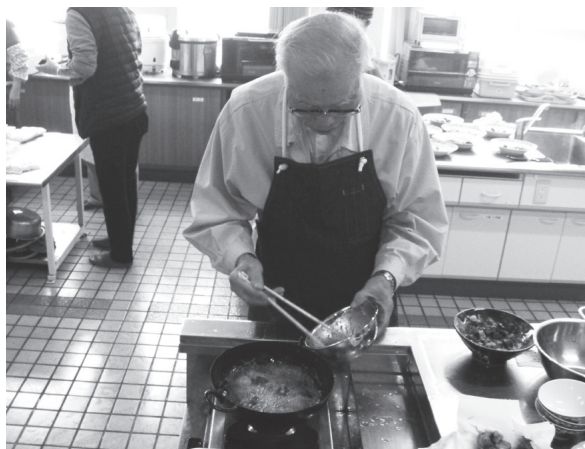
▲出来上がりを楽しみに料理する参加者

普段、田んぼや畑を荒らして邪魔者扱いされることの多いイノシシやシカですが、ちゃんと料理をすれば、おいしいジビエ料理になります。今回料理した2品のうち、シシジャがコロツケのレシピを紹介します。ぜひ、ジビエ料理に挑戦してみてください。