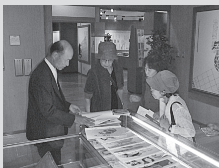
今年度の町外研修の様子【花回廊（左）と祐生出合いの館（右）】