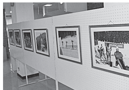
世界が熱狂した長野オリンピックの様子が伝わってくる