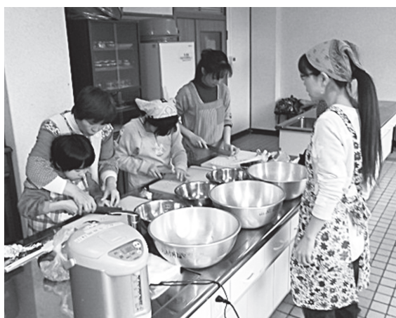
出来上がりを楽しみに調理

初めは慣れない手つきで包丁でチョコレイトを刻んでいましたが、作業が進むにつれて手際がよくなり、おいしいお菓子ができました。